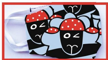
Talles ADULT i INFANTIL